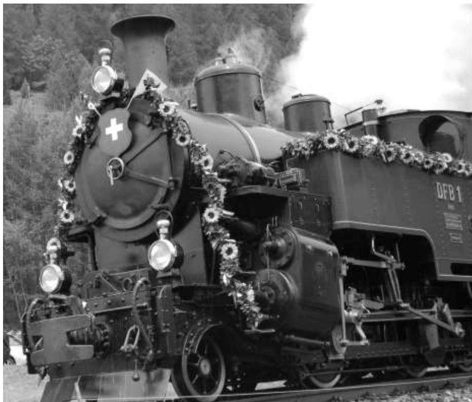
In 2010 bestond de Sectie Nederland 20 jaar, en vond ook de opening van het traject Gletsch-Oberwald plaats. Dit jaar vieren we weer feest, en wel ons 25-jarig jubileum