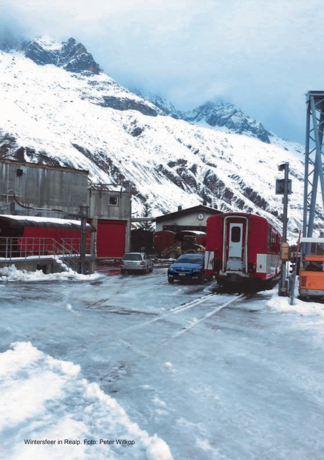
Wintersfeer in Realp.