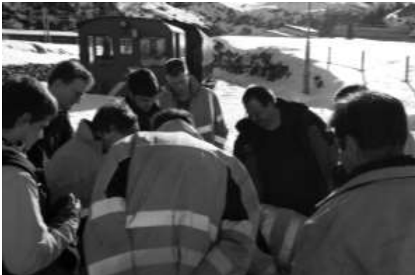
De cursisten bekijken aandachtig de instructies. Snel en juist handelen is immers van levensbelang bij lawine-ongevallen...

Zaterdagochtend hadden we alle gelegenheid om rustig aan te doen. Niet wat het ontbijt betreft natuurlijk want die was vanouds tussen 7 en 8. Om 11 uur precies heette Federico iedereen van harte welkom. Ik schat dat we met zo'n 20 man waren. Veel voor mij bekenden maar ook een aantal (jonge, nee Peter niet jij) nieuwkomers. We kregen uitleg over sneeuw, (vier) lawinesoorten (poedersneeuw, stuifsnieuw, sneeuwbank en natte sneeuw) met hun verschillende karakteristieken, de gevaren, verschil tussen begin en einde van de winter en noord- en zuidhellingen, de invloed van temperatuur, wind en zon, het verschil tussen ochtend en middag, wanneer we wel en niet sneeuwruimen (tot max.